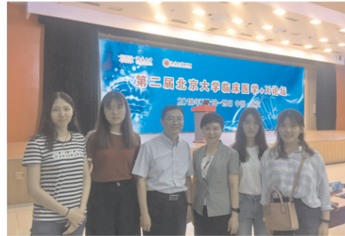
2018年学生赴北京大学彭直红教授实验室暑期实践并参加“北京大学临床医学+X论坛”

自2015年起，玛丽女王学院选派优秀学生赴北京大学、清华大学著名教授实验室参加暑期夏令营实习。学生们接受了基本科研训练，学到了基本实验技能，大大激发了他们对于科学研究的求知探索欲望。另外，2016年起，学院选派若干优秀学生参加清华大学-北京大学生命科学联合中心暑期培训班级及北大交叉学科夏令营。2019年寒假起，学院选派优秀生赴美国杜兰大学进行为期一个月的交流实习。