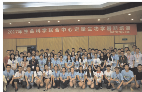
2017年生命科学联合中心 定量生物学暑期培训班