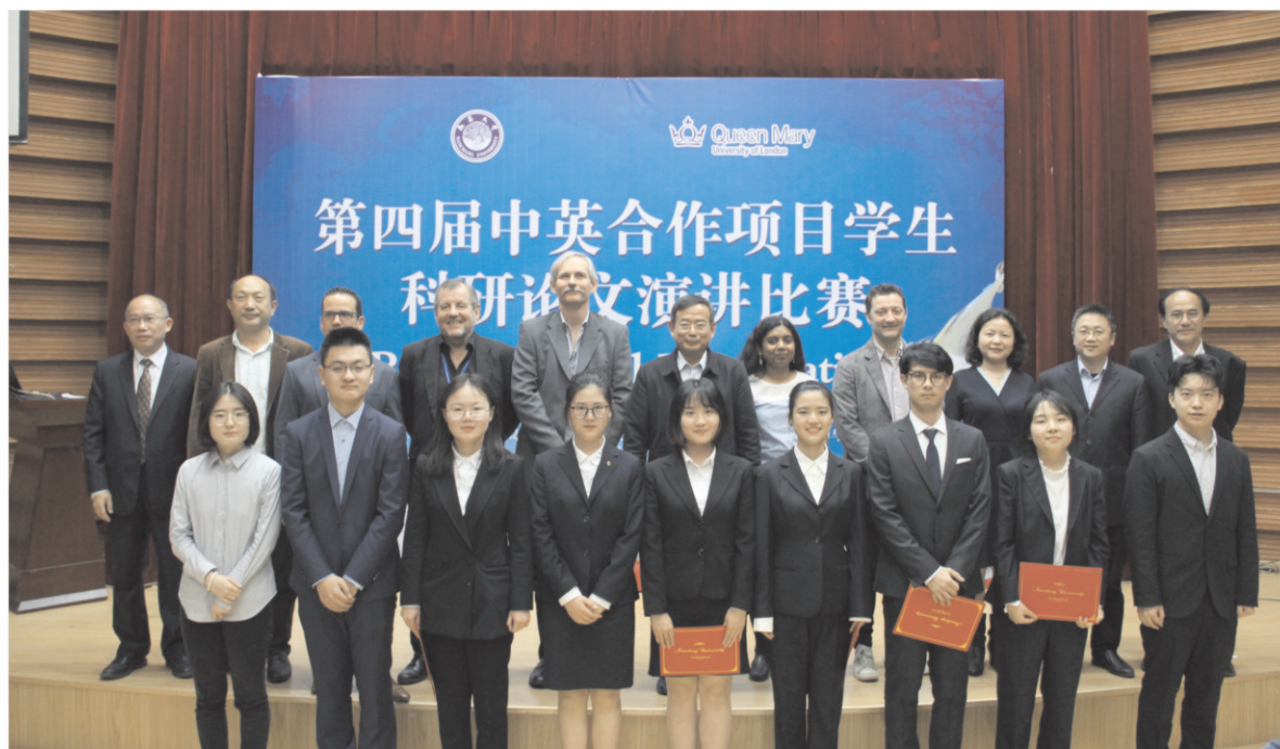
玛丽女王学院承办第四届中英合作项目学生科研论文演讲比赛